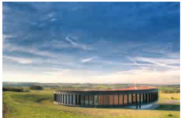
Das Limesium Ruffenhofen: Geschichte zum Anfassen

Einmal im Monat kann man im Kloster einen Nachmittag mit Gebet, Schweigen und Meditation verbringen und den Alltag vor den Klostermauern lassen.