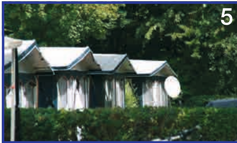
Campingurlaub im Grünen