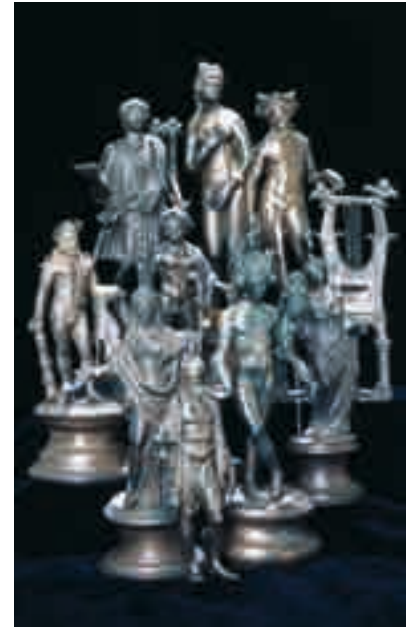
Anmutige Kunst der Antike: die Statuen des Römerschatzes