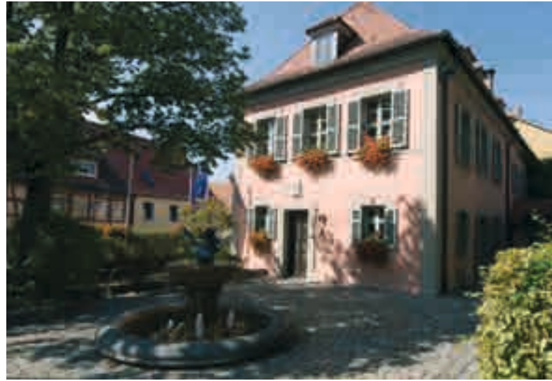
Der Wilde Markgraf hat in Gunzenhausen seine Spuren hinterlassen

In Gunzenhausen fügen sich barocke Prachtbauten, mittelalterliche Wehrtürme und fränkische Fachwerkstadel zu einer eindrucksvollen Kulisse. Die Stadt ist ein moderner Urlaubsort, der sich seine Seele bewahrt hat. Gäste können auf dem langgezogenen Marktplatz in einem der Straßencafés oder Restaurants Platz nehmen oder sich auf einen Einkaufsbummel in den Gassen der Stadt mit ihren vielen kleinen Geschäften einlassen. Wer danach Ruhe braucht, flaniert auf der Altmühlpromenade zum nahen Altmühlsee. Seine heutige Bedeutung hat die Stadt dem „Wilden Markgrafen“ zu verdanken. Der Hohenzoller-Fürst floh nur allzu gerne vor dem Hofleben in Ansbach und widmete sich in Gunzenhausen gleichermaßen leidenschaftlich der Jagd und seiner langjährigen Geliebten. Er hinterließ der Stadt zahlreiche Barockbauten, die das Bild Gunzenhausens bis heute prägen.