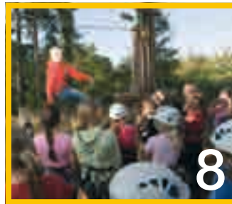
Mit 60 km/h über den See