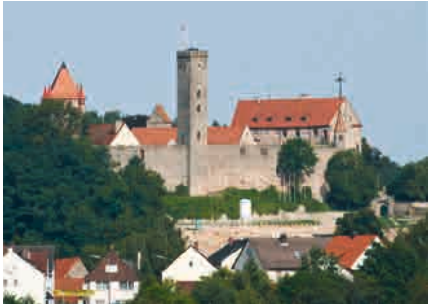
Burg Abenberg – eine Ritterburg wie aus dem Bilderbuch