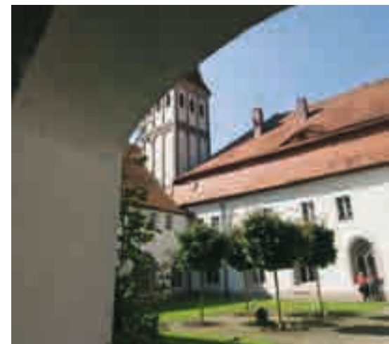
Kloster Heidenheim: Eine Keimzelle der Christianisierung