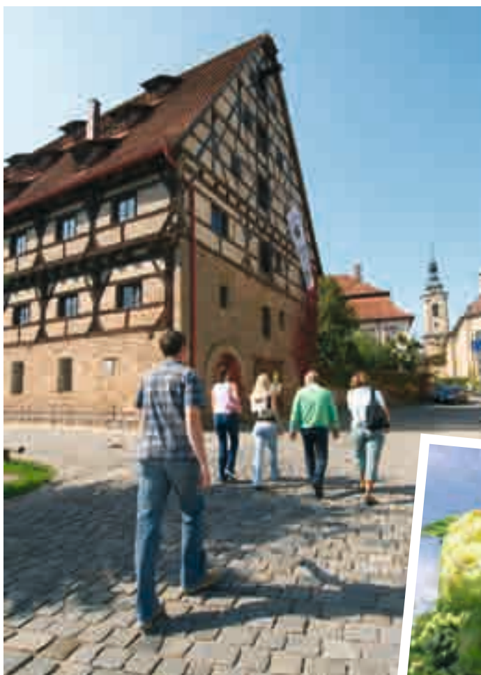
Spaziergang durch die Hopfenstadt Spalt