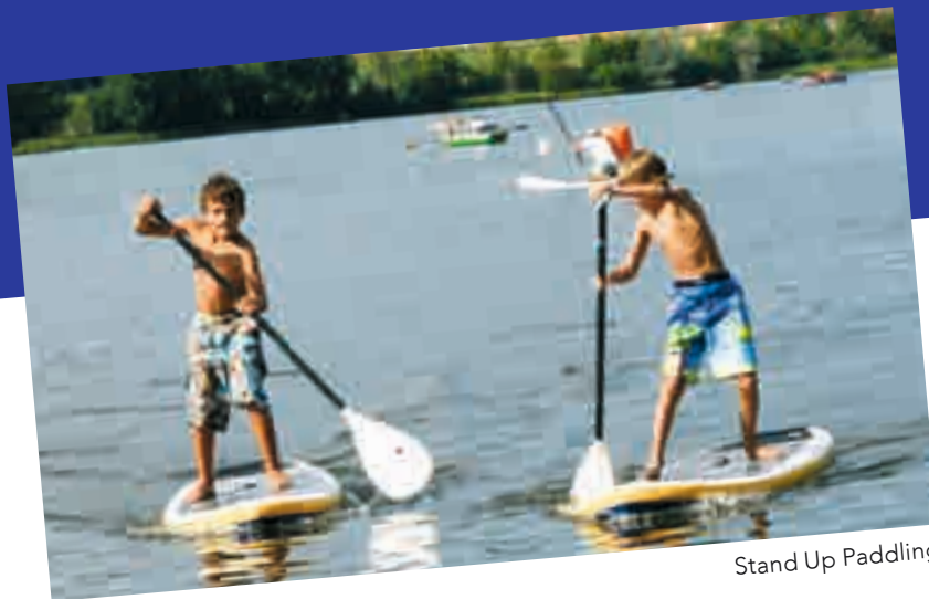
Stand Up Paddling

Im Wasser, auf dem Wasser, über dem Wasser und rund ums Wasser