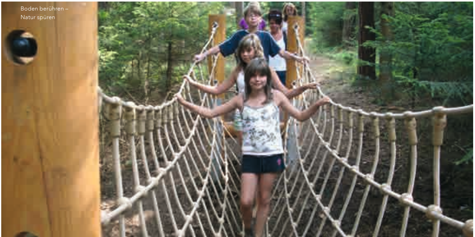
Boden berühren – Natur spüren

Strände und Spielplätze machen das Radeln am See zu einem Vergnügen für die ganze Familie. Wer Abstecher ins fränkische Hinterland machen will, muss sich vor der hügeligen Landschaft nicht weiter fürchten. Mit E-Bikes lassen sich Steigungen überwinden, ohne ins Schwitzen zu kommen. Und der Akku wird garantiert nicht leer. Dafür sorgen zahlreiche kostenlose Ladepunkte an Cafés, Gaststätten und Touristinfos in der Region.