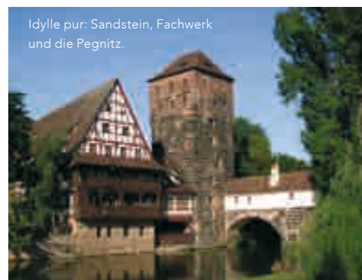
Idylle pur: Sandstein, Fachwerk und die Pegnitz.

Besuch der Frankenmetropole. Mit seiner Vergangenheit als Aufmarschort der Nationalsozialisten setzt sich die Stadt im beeindruckenden Dokumentationszentrum auf dem Reichsparteitagsgelände auseinander. Darüber hinaus bietet Nürnberg die Gelegenheit, fränkische Lebensart zu genießen. Etwa in einer der berühmten und zahlreichen Wurstküchen der Stadt. Dort bestellt man am besten „Sechs auf Kraut“. Wer es eiliger hat, versorgt sich an einer der vielen Imbissbuden, und ordert dann fachmännisch „Drei im Weckla“.