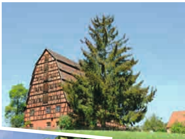
Typisches Hopfenhaus; auf bis zu sechs Stockwerken wurde die Ernte gelagert und getrocknet