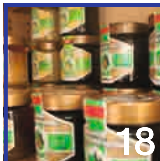
Kulinarik aus der Region