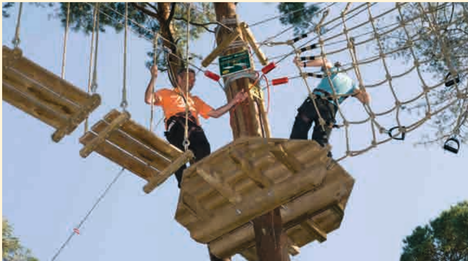
Vor dem Flug über den See: ein Besuch im Klettergarten.