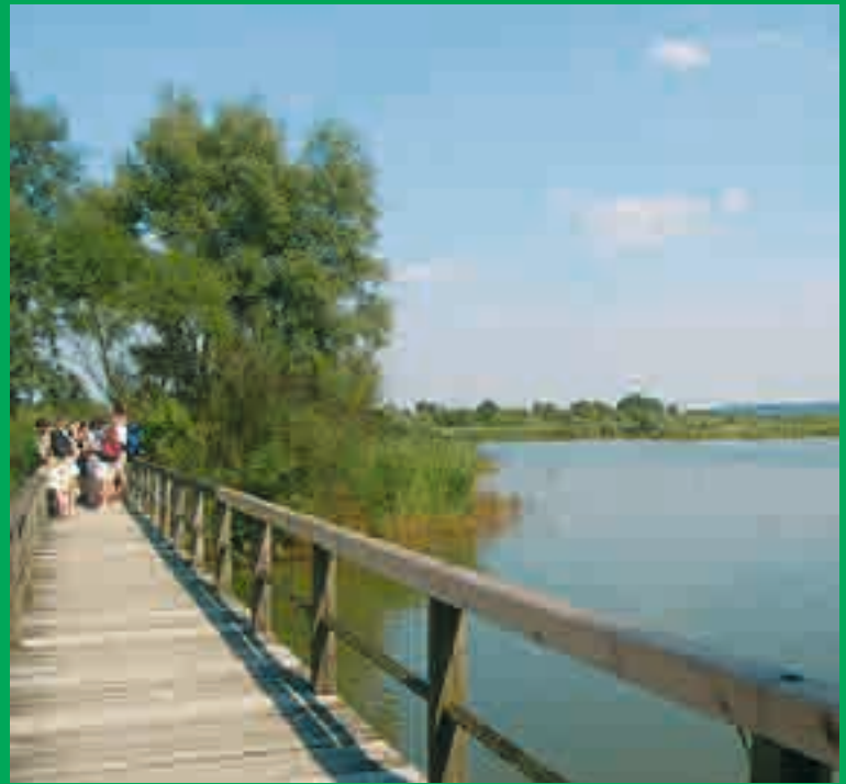
Rikscha-Tour am Brombachsee