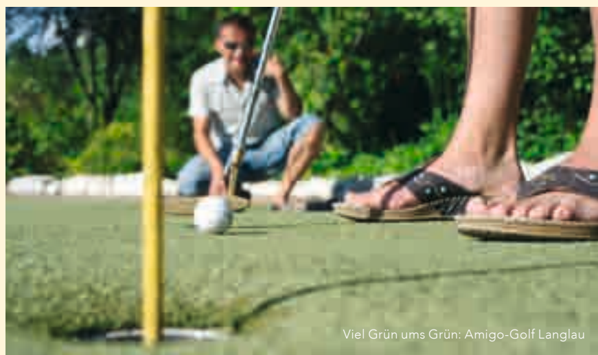
Viel Grün ums Grün: Amigo-Golf Langlau