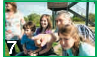
Auf der Suche nach dem Seeadler